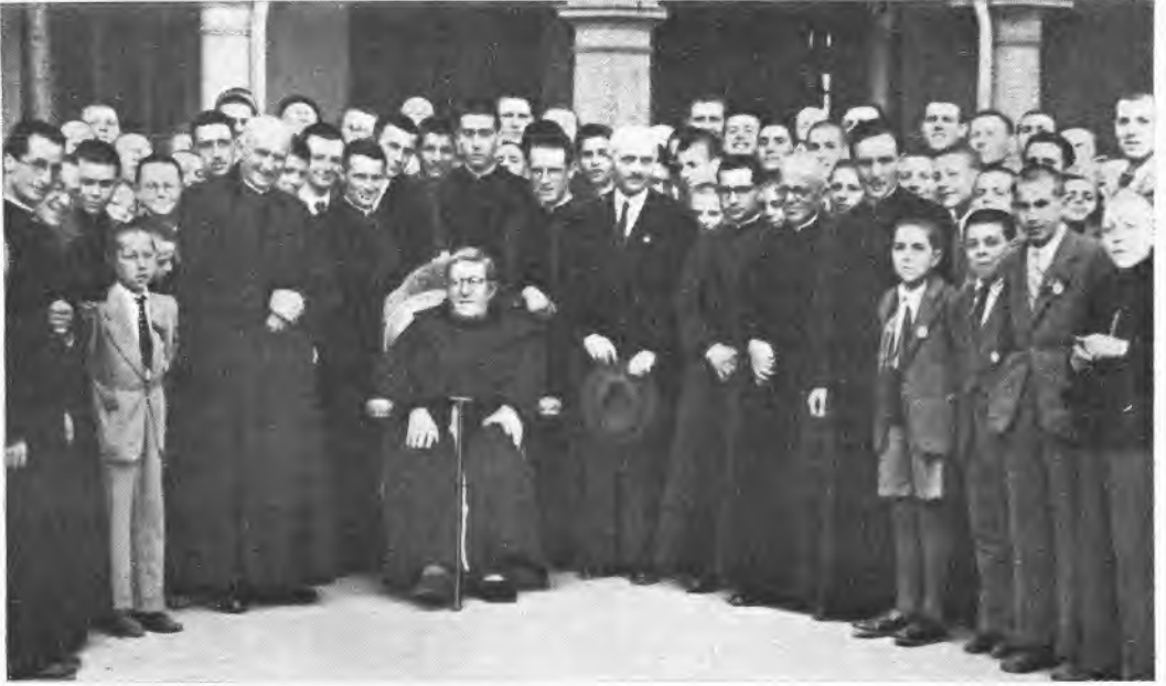
Torino - S. E. Padre Gemelli col nostro Rettor Maggiore all'Istituto "Conti Rebaudengo".