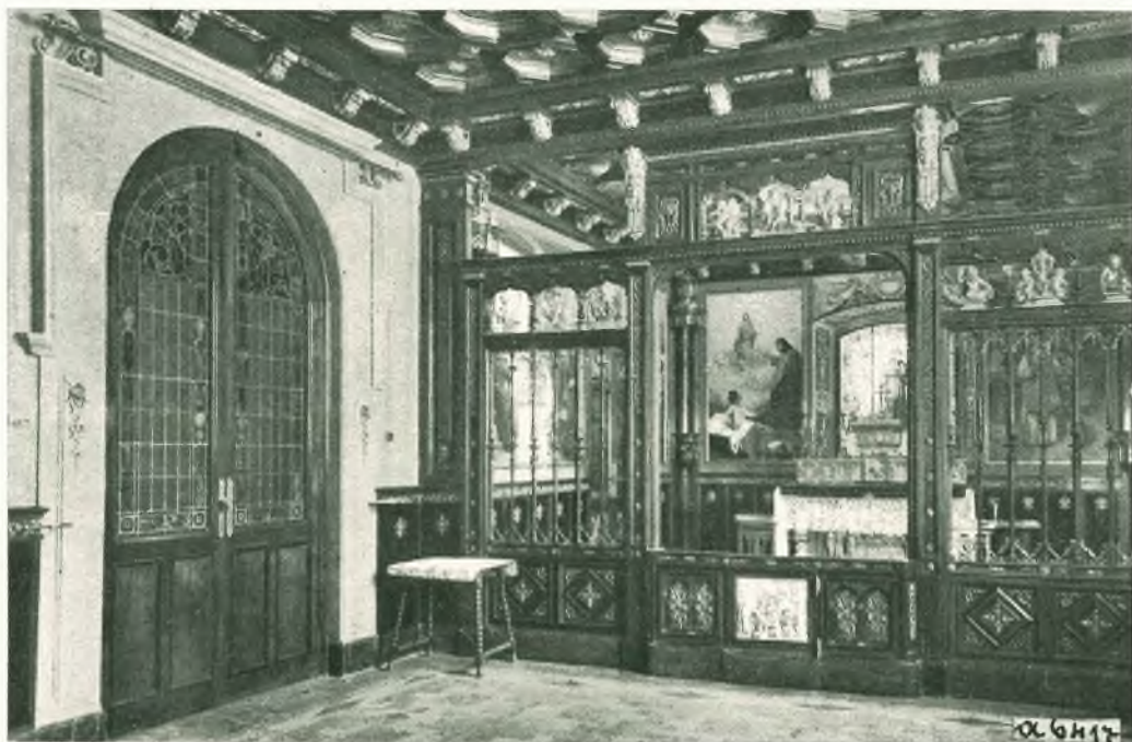
Nel nostro Collegio di SARRIÀ-BARCELONA (Spagna) è stato rimesso in ordine l'appartamentino occupato da D. Bosco durante il suo soggiorno nel 1886 e devastato dai rivoltosi. Ecco una fotografia della cameretta convertita in cappella e decorata con quadri artistici della vita del Santo.