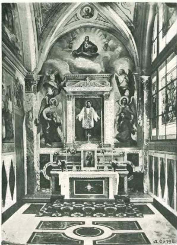
Romentino - La Cappella dedicata a San Giovanni Bosco nella chiesa parrocchiale.