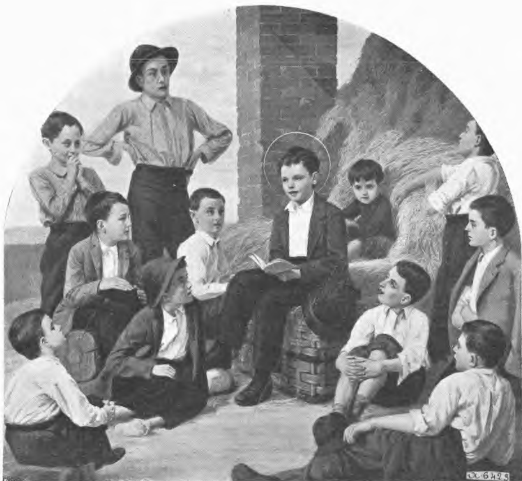
Giovanni Bosco presso la casa natia tiene ai coetanei una lezione di Catechismo. (Quadro del Crida nella sagrestia della Basilica di Maria Ausiliatrice in Torino).